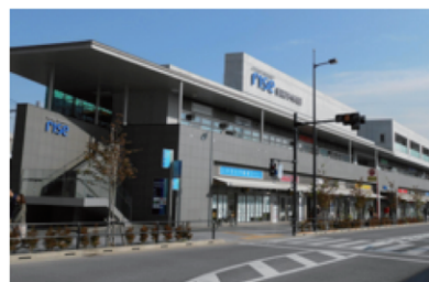
二子玉川駅バスターミナルにある「二子玉川交番」から、道路を挟んで向かいにある2階建ての建物です。

会場 | 玉川町会会館 東京都世田谷区玉川2丁目2-1 二子玉川ライズ・バースモール2階 (209号室)